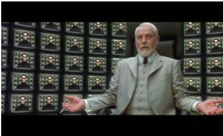
Il Grande Architetto dell'Universo massonico. Tratto da Matrix.

Problema \Rightarrow Reazione \Rightarrow Soluzione